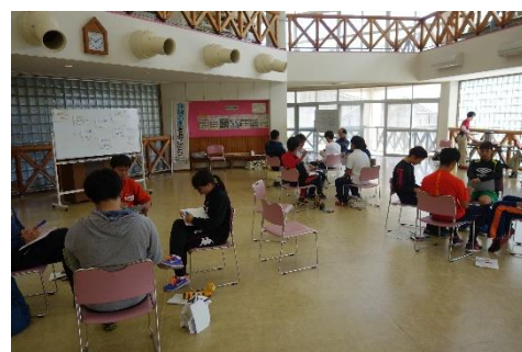
全体でのふりかえりで TAP の効果や自分のフィールドでどう活かしていくかを交流しました。閉講式では参加者全員に修了証をお渡しし、2日間の研修を終わりました。