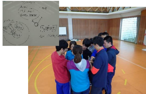
理論やファシリテーターの意図も織り交ぜながら活動を積み重ねていきました。