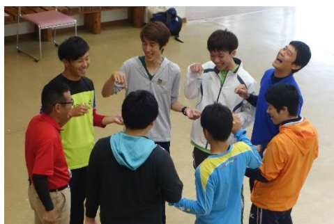
ねらいを持った様々な体験活動を通して少しずつ緊張がほぐれ、笑顔が出てきました。