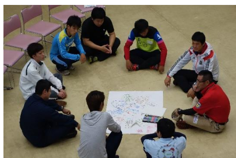
ビーイングを作成し、グループで大切にしたいことを確認しながら活動します。