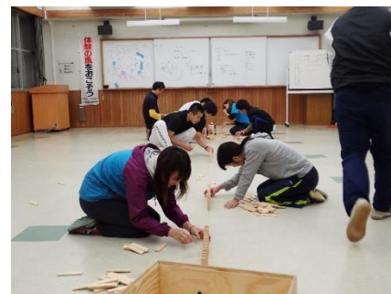
グループの変化はなぜ起きたのかを交流し、グループへの自分の関わり方を考え、ビーイングに書き込んでいきます。