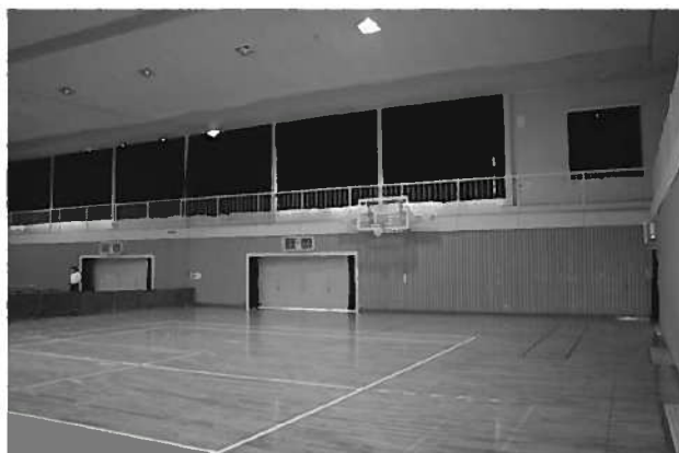
バレーボール1面, バドミントン6面, バスケットボール1面, 卓球10台