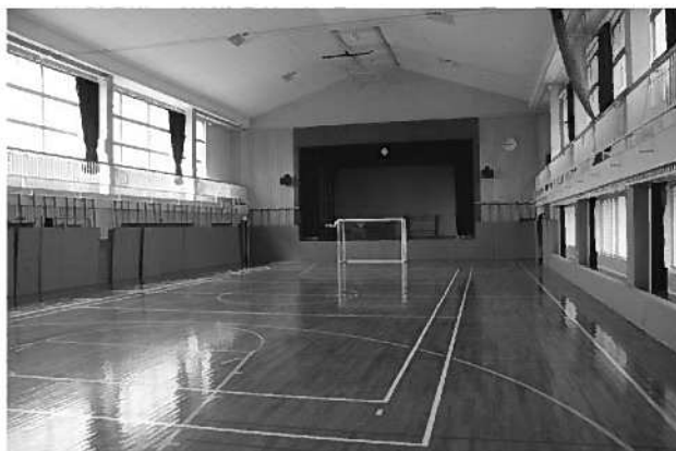
サッカー1面, フットサル1面