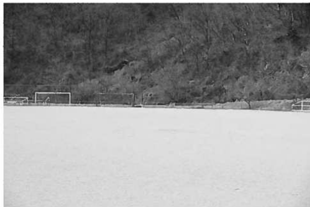
野球1面, ソフトボール2面, サッカー1面