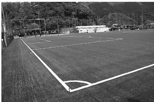
やまぐちサッカー交流広場