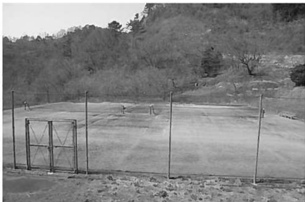
長者ヶ原運動公園