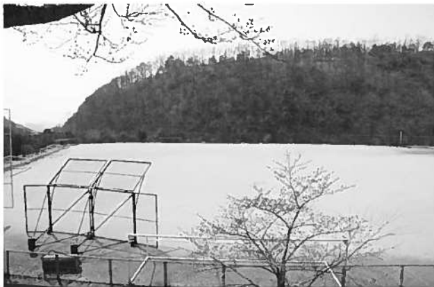
長者ヶ原運動公園