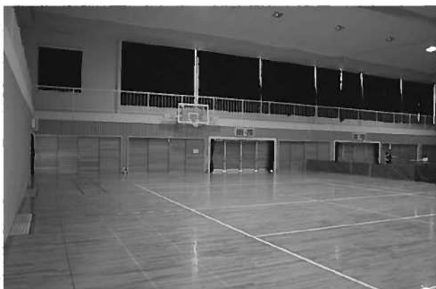
山口市徳地体育館