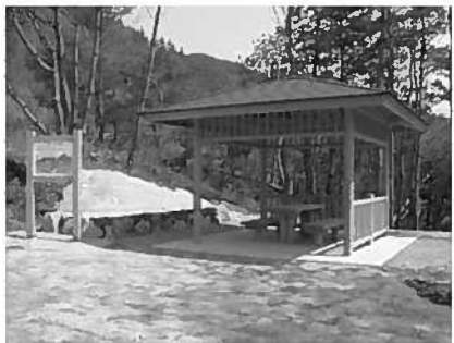
登山口の東屋 (「やすらぎの森整備事業」で設置)