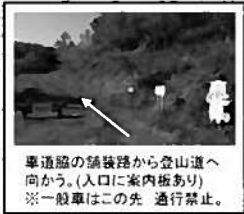
車道脇の舗装路から登山道へ向かう。(入口に案内板あり) ※一般車はこの先 通行禁止。

<注意> こちらの登山道は十分に整備されておらず、自然の家での活動には利用されていません。途中には急な斜面、倒木、ヤブなどがあるので、注意して通行してください。