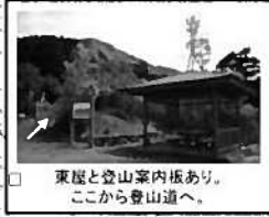
東屋と登山案内板あり。ここから登山道へ。

国立山口徳地青少年自然の家 TEL 0835-56-0111 ご希望により熊よけ鈴、無殺虫剤を貸し出しますので、入山前に事務室へお立ち寄りください。