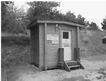
登山口下にあるバイオトイレ

日暮ヶ岳登山道 自然の家からの標高差…約330m 自然の家からの距離…約2.3km 登山所要時間(往復コース) …上り 約60分/下り 約50分