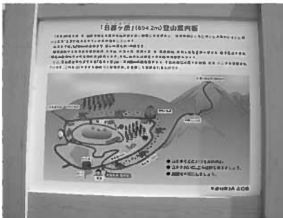
登山口の案内板 (「やすらぎの森整備事業」で設置)