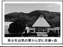
青少年自然の家から望む日暮ヶ岳

南から西にかけての眺めが良く、防府の大平山や右田ヶ岳、山口の鳳凰山や苜蓿ヶ岳などが一望できます。