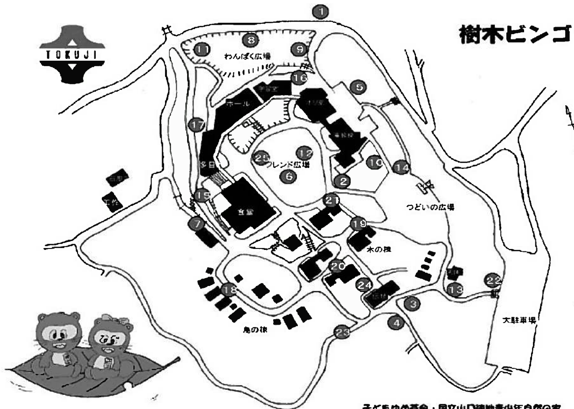
子どもゆめ基金・国立山口徳地青少年自然の家