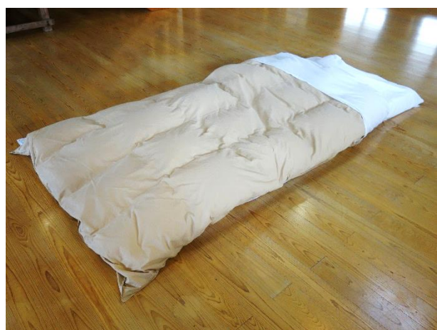
⑤3枚目のシーツの上に、毛布、羽毛布団の順で置いて、3枚目のシーツを折り返して完成です。