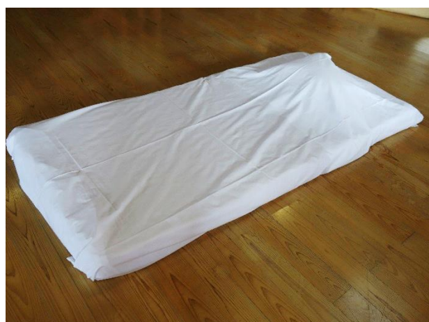
③2枚目のシーツで敷布団全体を覆うように置きます。