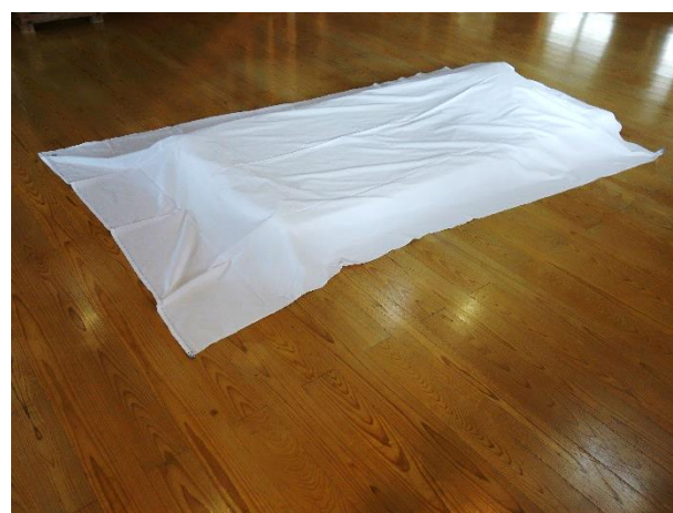
④3枚目のシーツを③の状態の敷布団の上に置きます。