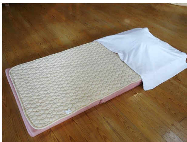
②配置した枕の上に、1枚目のシーツを二つ折にしたシーツを置きます。