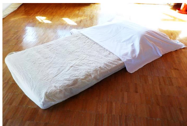
②配置した枕の上に、1枚目のシーツを二つ折にしたシーツを置きます。