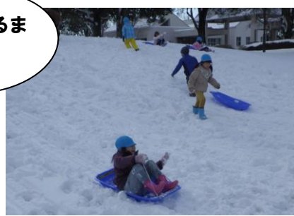
楽しいそりすべり