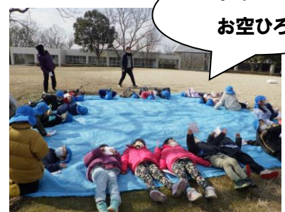
ちょっと休憩 お空を見てみよう