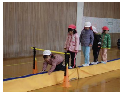
上手にくぐれるよ