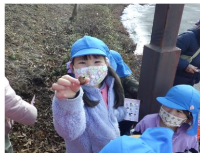
木の实を見つけたよ!