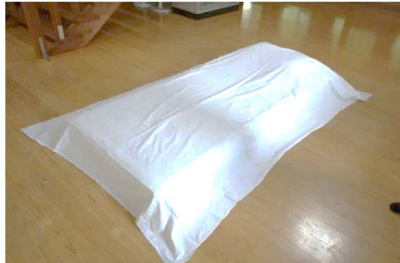
④3枚目のシーツを③の状態の敷布団の上に置きます。