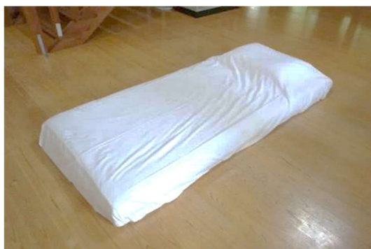
③2枚目のシーツで敷布団全体を覆うように置きます。