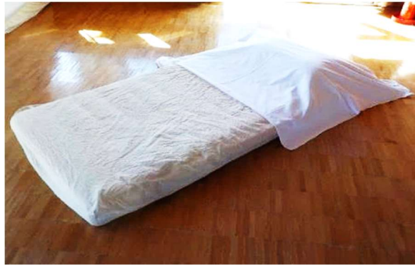
②配置した枕の上に、1枚目のシーツを二つ折にしたシーツを置きます。