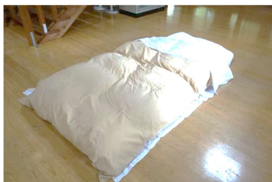
⑤3枚目のシーツの上に、毛布、羽毛布団の順に置いて、3枚目のシーツを折り返して完成です。 ※2枚目と3枚目の間に入って就寝してください。